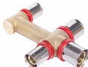
CROIX · CROSS · CRUZ · CRUZ